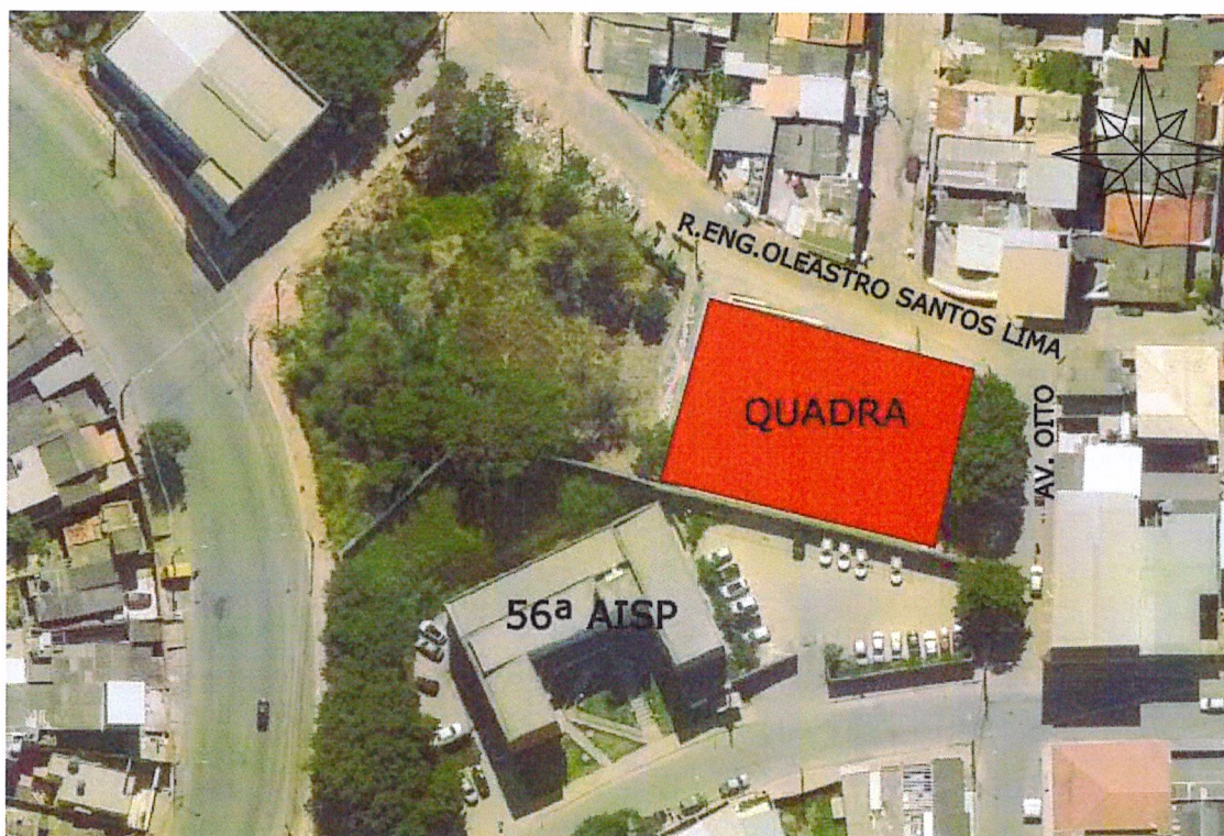
Figura 1 – Localização do terreno e área de intervenção

A contratada deverá realizar visita no local para verificar as necessidades e as demandas deste memorial.